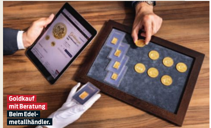
Goldkauf mit Beratung Beim Edel- metallhändler.